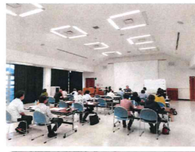
写真：令和5年度 上級講座(八重山)の様子

素晴らしい講師教授の指導を受けさせてもらい感謝しています。基礎知識からしまくとぅばの教育法まで、大変勉強になりました。